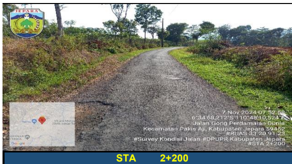
FOTO SURVEY KONDISI JALAN TAHUN 2024

Jalan Kartini No. 27 Telp. (0291) 591032 – 591015 Jepara 59417