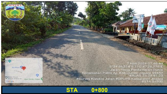
FOTO SURVEY KONDISI JALAN TAHUN 2024

Jalan Kartini No. 27 Telp. (0291) 591032 – 591015 Jepara 59417