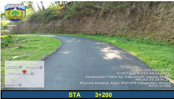
FOTO SURVEY KONDISI JALAN TAHUN 2024

Jalan Kartini No. 27 Telp. (0291) 591032 – 591015 Jepara 59417