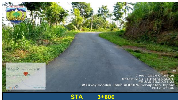
FOTO SURVEY KONDISI JALAN TAHUN 2024

Jalan Kartini No. 27 Telp. (0291) 591032 – 591015 Jepara 59417