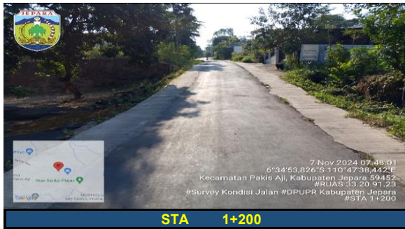
FOTO SURVEY KONDISI JALAN TAHUN 2024

Jalan Kartini No. 27 Telp. (0291) 591032 – 591015 Jepara 59417