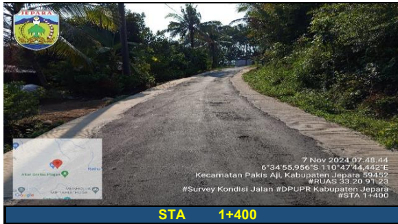
FOTO SURVEY KONDISI JALAN TAHUN 2024

Jalan Kartini No. 27 Telp. (0291) 591032 – 591015 Jepara 59417