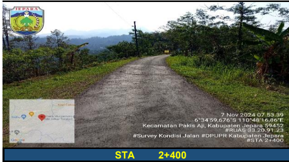
FOTO SURVEY KONDISI JALAN TAHUN 2024

Jalan Kartini No. 27 Telp. (0291) 591032 – 591015 Jepara 59417