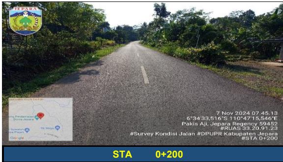
FOTO SURVEY KONDISI JALAN TAHUN 2024

PEMERINTAH KABUPATEN JEPARA DINAS PEKERJAAN UMUM DAN PENATAAN RUANG Jalan Kartini No. 27 Telp. (0291) 591032 – 591015 Jepara 59417