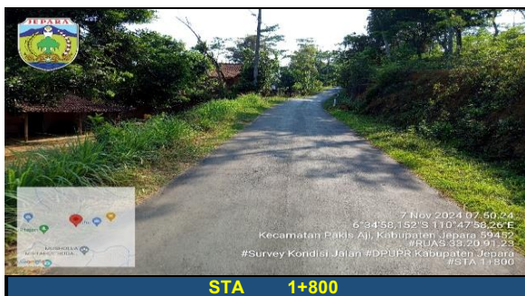
FOTO SURVEY KONDISI JALAN TAHUN 2024

Jalan Kartini No. 27 Telp. (0291) 591032 – 591015 Jepara 59417