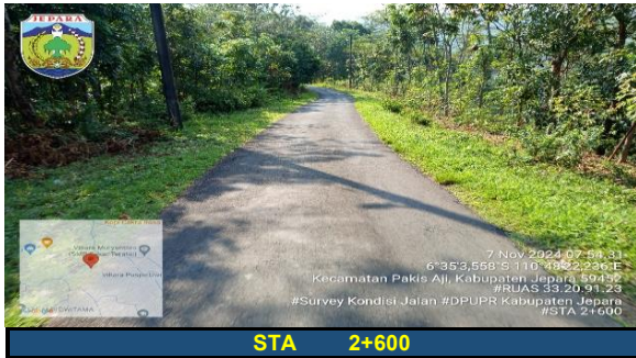
FOTO SURVEY KONDISI JALAN TAHUN 2024

Jalan Kartini No. 27 Telp. (0291) 591032 – 591015 Jepara 59417