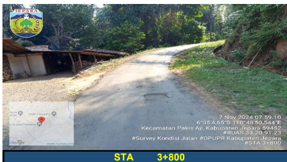
FOTO SURVEY KONDISI JALAN TAHUN 2024

Jalan Kartini No. 27 Telp. (0291) 591032 – 591015 Jepara 59417