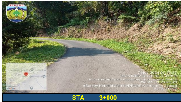
FOTO SURVEY KONDISI JALAN TAHUN 2024

Jalan Kartini No. 27 Telp. (0291) 591032 – 591015 Jepara 59417