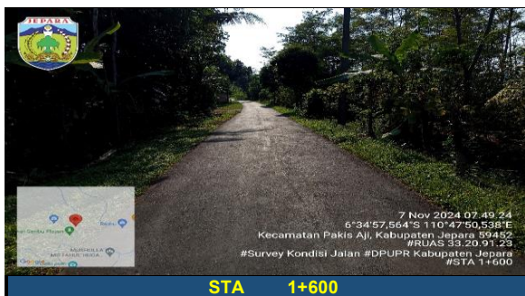
FOTO SURVEY KONDISI JALAN TAHUN 2024

Jalan Kartini No. 27 Telp. (0291) 591032 – 591015 Jepara 59417