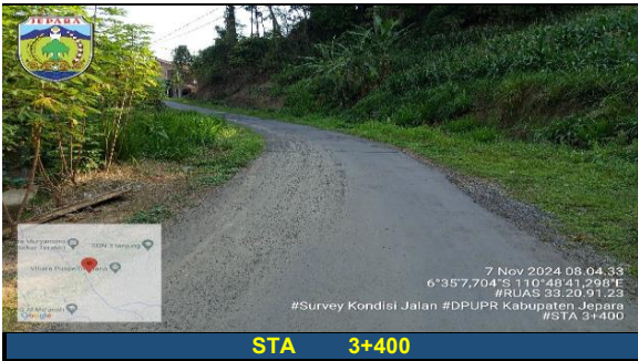
FOTO SURVEY KONDISI JALAN TAHUN 2024

Jalan Kartini No. 27 Telp. (0291) 591032 – 591015 Jepara 59417