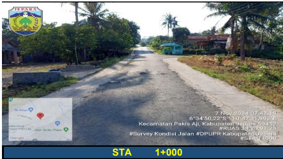
FOTO SURVEY KONDISI JALAN TAHUN 2024

Jalan Kartini No. 27 Telp. (0291) 591032 – 591015 Jepara 59417