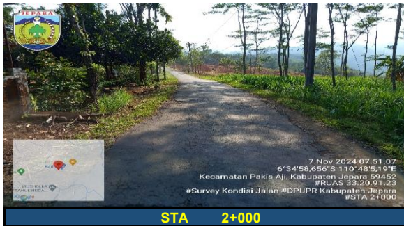
FOTO SURVEY KONDISI JALAN TAHUN 2024

Jalan Kartini No. 27 Telp. (0291) 591032 – 591015 Jepara 59417