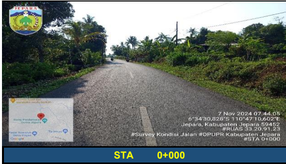
FOTO SURVEY KONDISI JALAN TAHUN 2024

PEMERINTAH KABUPATEN JEPARA DINAS PEKERJAAN UMUM DAN PENATAAN RUANG Jalan Kartini No. 27 Telp. (0291) 591032 – 591015 Jepara 59417