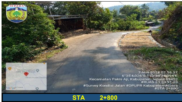
FOTO SURVEY KONDISI JALAN TAHUN 2024

Jalan Kartini No. 27 Telp. (0291) 591032 – 591015 Jepara 59417